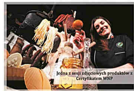
Jedna z sesji zdjęciowych produktów z Certyfikatem WNP