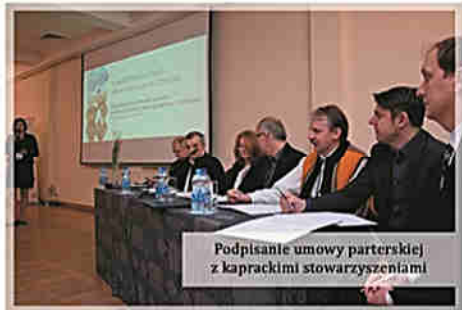
Podpisanie umowy partnerskiej z kaprackimi stowarzyszeniami