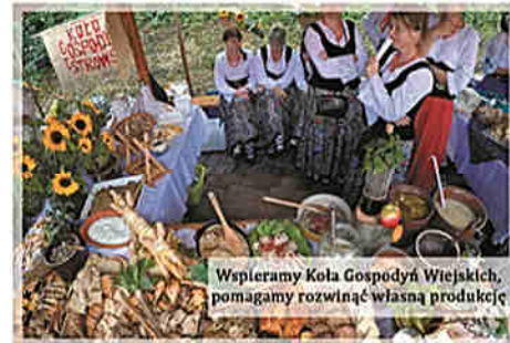
Wspieramy Koła Gospodyń Wiejskich, pomagamy rozwinąć własną produkcję