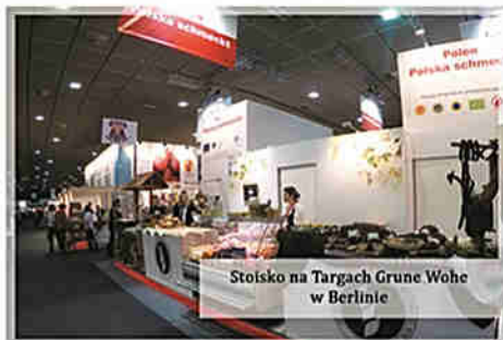
Stoisko na Targach Grune Wohe w Berlinie