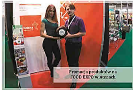
Promocja produktów na FOOD EXPO w Atenach