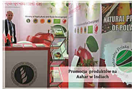
Promocja produktów na Aahar w Indiach