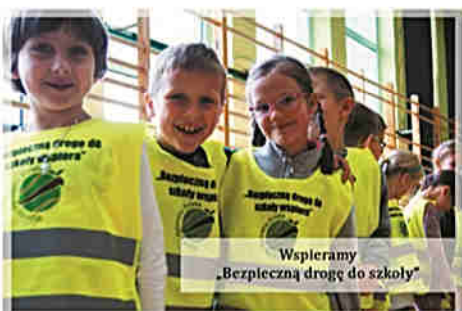
Wspieramy „Bezpieczną drogę do szkoły”