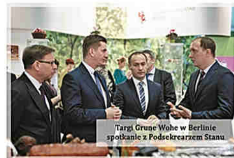
Targi Grune Wohe w Berlinie spotkanie z Podsekretarzem Stanu