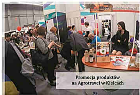
Promocja produktów na Agrotravel w Kielcach