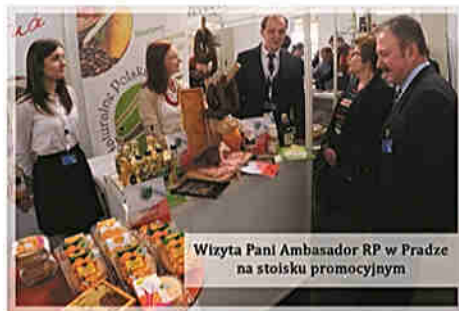
Wizyta Pani Ambasador RP w Pradze na stoisku promocyjnym