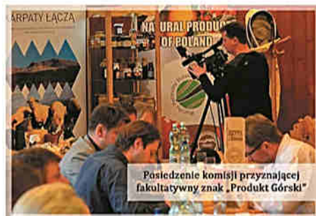
Posiedzenie komisji przyznającej fakultatywny znak „Produkt Górski”